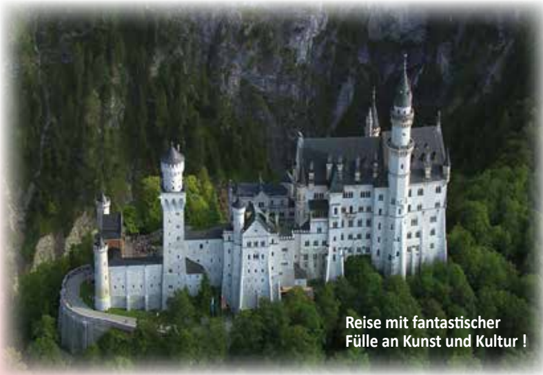
Reise mit fantastischer Fülle an Kunst und Kultur !